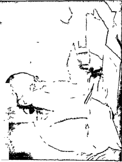
मानवधर्मव्याख्याता आचार्य श्रीभगवान्दास